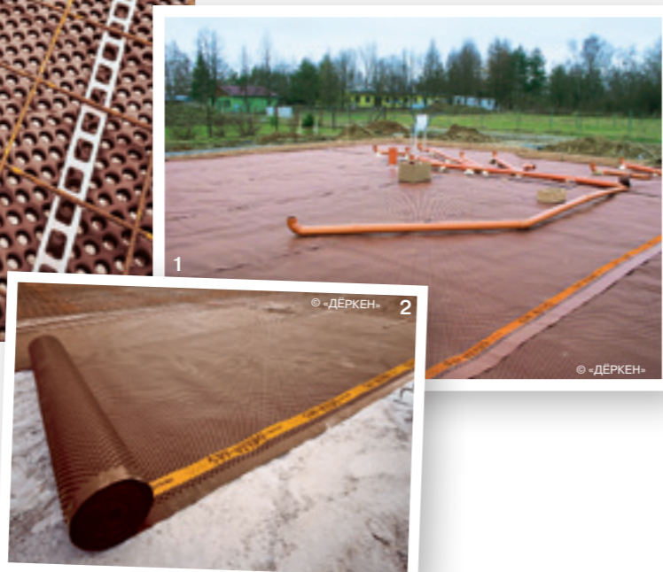
Бетонная подготовка и её замена профилированной мембраной:

Важный этап возведения плитного фундамента – выполнение бетонной подготовки в виде выравнивающего слоя из бетона низкой марки. Устройство такой подготовки затратно, трудоёмко и связано с рядом сложностей для заказчика, поэтому всё чаще предпочтение отдаётся её современной альтернативе – профилированной мембране из полиэтилена высокой плотности